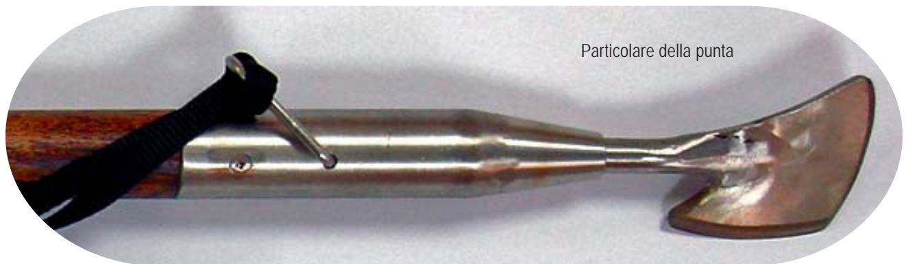
Particolare della punta