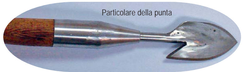
Particolare della punta