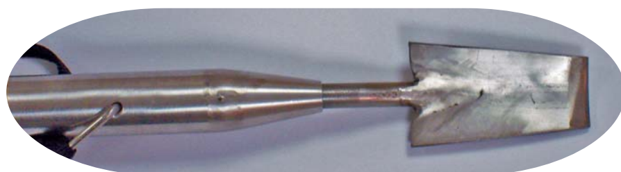
Particolare della punta