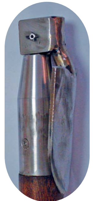
Punta richiudibile: particolare